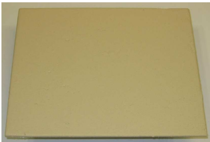
A005: FERMACELL Fugenspachtel

Hinweis: Die Untersuchungsergebnisse beziehen sich ausschließlich auf den vorgelegten Prüfgegenstand. Der Bericht verliert umgehend seine Gültigkeit bei Änderungen der Zusammensetzung oder des Produktionsverfahrens des Prüfgegenstandes. Eine vollständige oder auszugsweise Veröffentlichung des Prüfberichtes bedarf der Genehmigung.